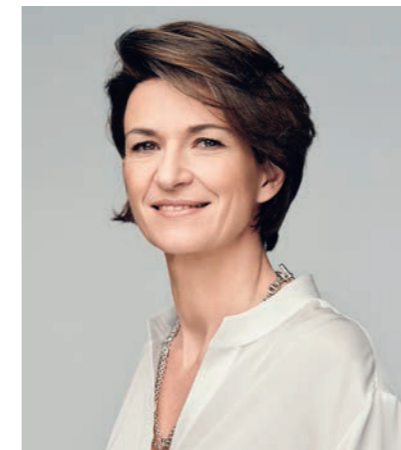
ISABELLE KOCHER PREZES ZARZĄDU ENGIE

20% podróży w dużych i średnich miastach w krajach rozwiniętych w latach 2001-2012 odbywało się z wykorzystaniem transportu publicznego.